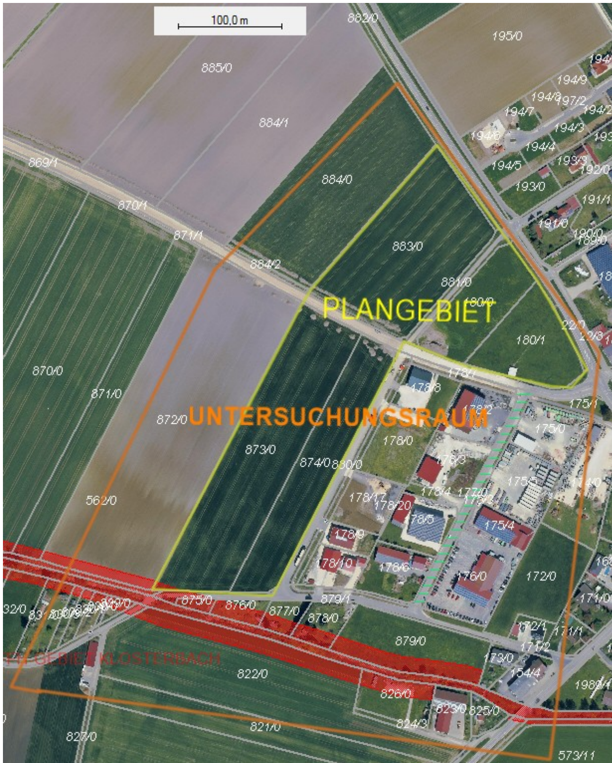
Abbildung 3: Untersuchungsraum