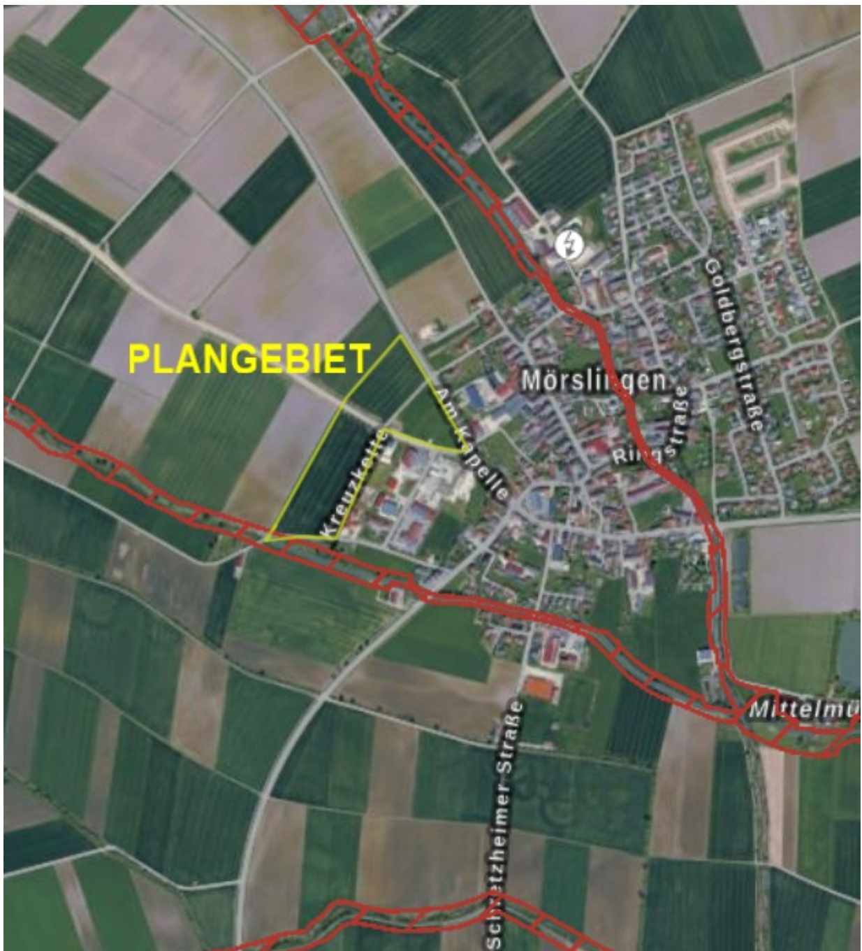
Abbildung 2: Übersichtsplan