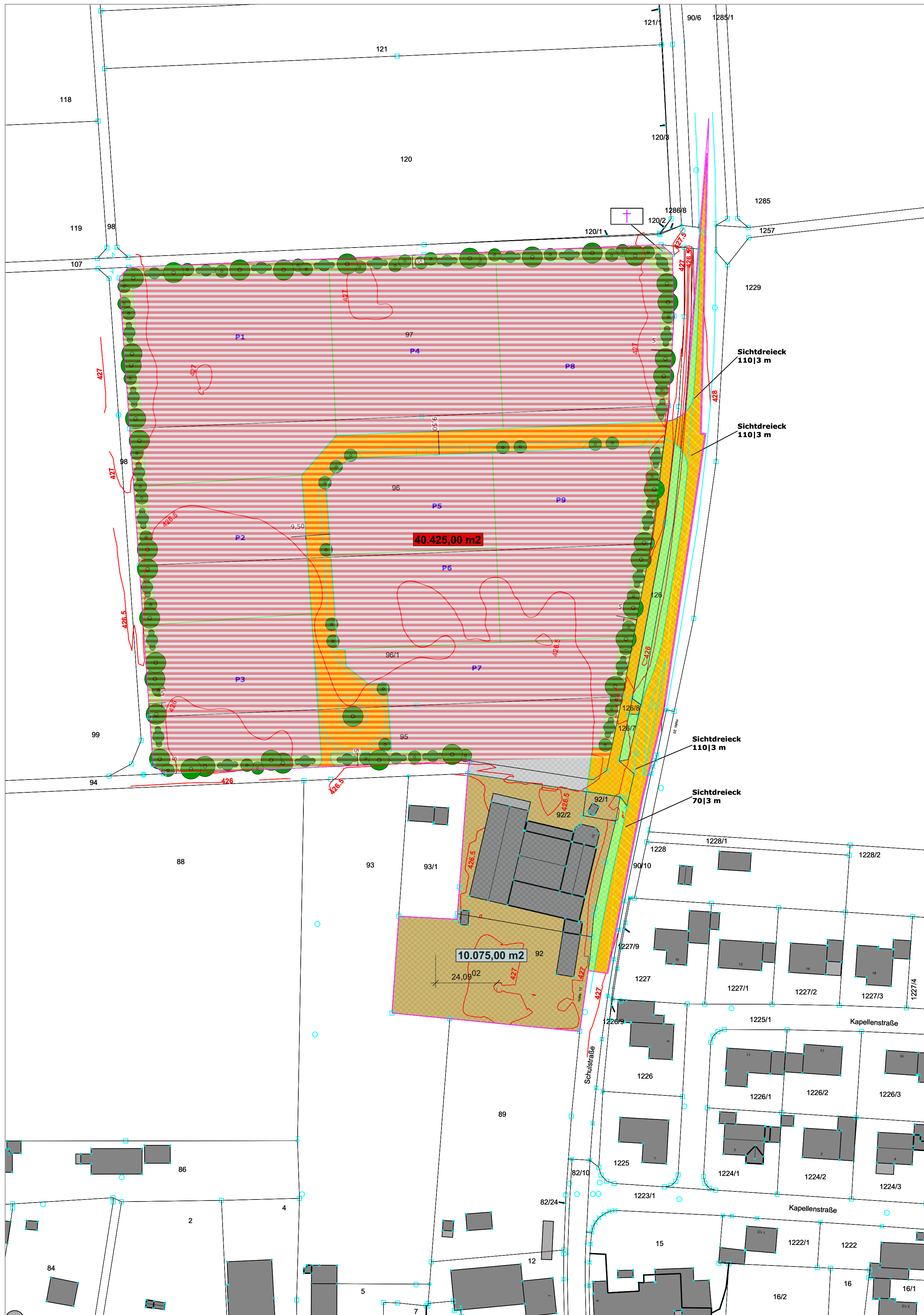
Planzeichnung Maßstab 1:1.000

Plangrundlage: Bayerische Vermessungsverwaltung