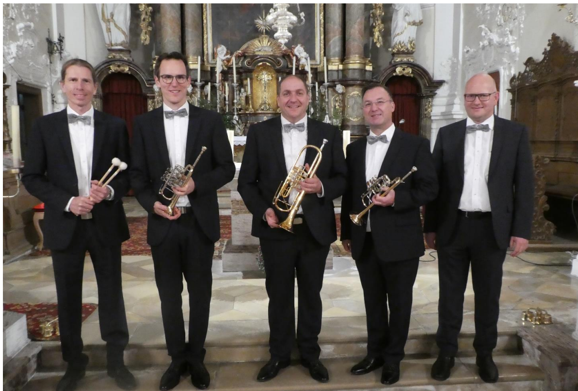
Zum Bild