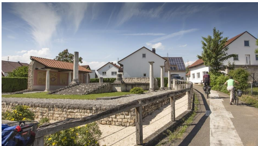
Apollo Grannus Tempel Faimingen

Nicht zuletzt gibt es auch für Sightseeing-Fans und Kulturbegosteerte Spannendes im Dillinger Land zu entdecken: eine der größten römischen Tempelanlagen nördlich der Alpen, die Sieben Kapellen und vieles mehr. Verbunden mit einem Stadtbummel verspricht das wahre Urlaubfeeling. Neugierig geworden? Alle Ausflugsstipps, Touren und Einkehrmöglichkeiten sowie einen prall gefüllten Veranstaltungskalender findet man in wenigen Klicks unter www.dillingerland.de . Infomaterial kann kostenlos über die Webseite oder telefonisch unter 07325 9510140 angefordert werden.