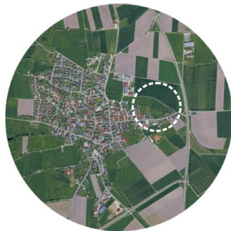
Gemeinde Lutzingen Baugebiet „Oberglauheimer Straße“

Die vom Gemeinderat beschlossene Ausweisung von weiterem Bauland in Lutzingen hat eine weitere wichtige Hürde genommen. So hat der Gemeinderat die Aufstellung des Bebauungsplans „Oberglauheimer Straße“ in der Fassung vom 4. April 2022 gebilligt und nach vorheriger Beteiligung der Träger öffentlicher Belange und der Öffentlichkeit Änderungen und