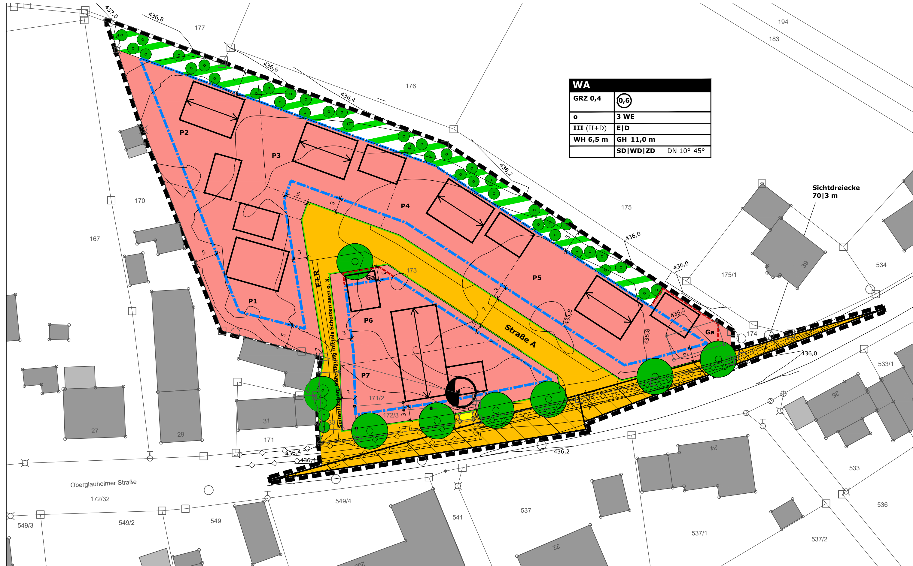
Planzeichnung Maßstab 1:500

Plangrundlage: Bayerische Vermessungsverwaltung