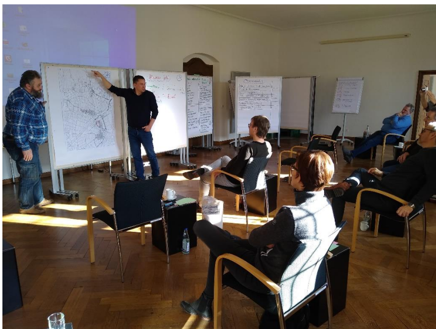
Die Gemeinderatsmitglieder bei der Arbeit

Am Freitag 4. und Samstag 5. Februar 2022 machten sich 10 Mitglieder des Gemeinderats auf nach Thierhaupten zur Schule der Dorf- und Landentwicklung Thierhaupten e.V. (SDL). Dort stand eine gemeinderatsinterne Klausur zum Thema „Gemeindeentwicklung“ auf dem Programm. Ziel des Treffens war es, sich ohne Zeitdruck Gedanken zur weiteren Entwicklung unserer Gemeinde zu machen.