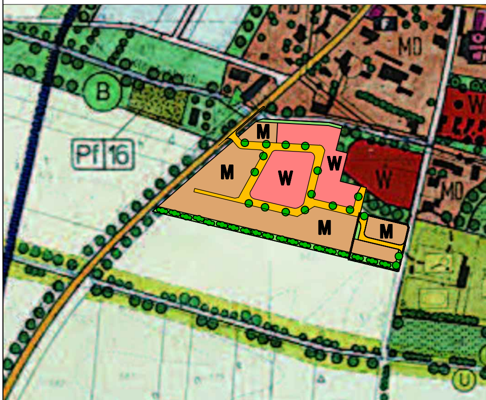
Änderung des Flächennutzungsplans