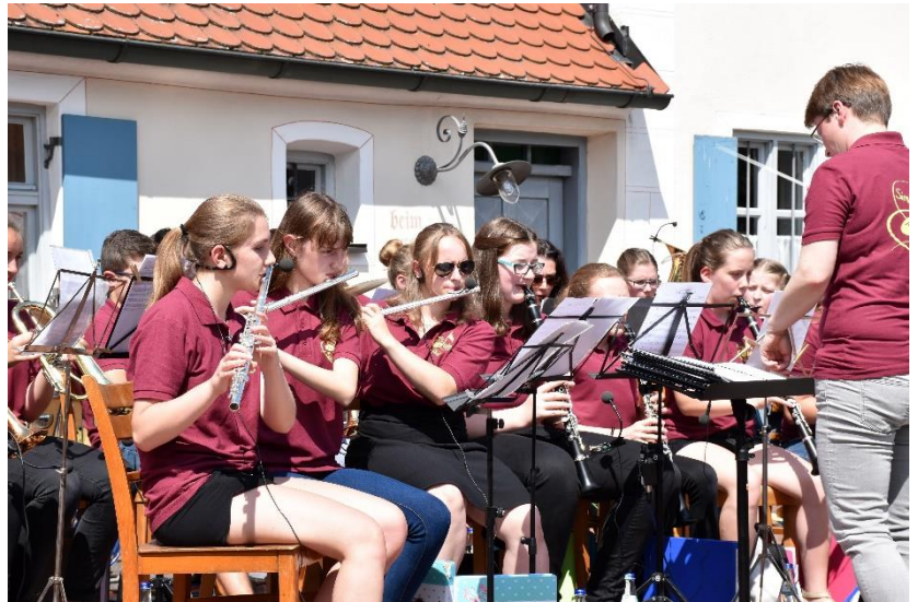
Die Jugendkapelle des Musikvereins Donauklang

Am Freitag, den 16.10.2020, von 19.00 bis ca. 20 Uhr werden anhand verschiedener Musikstücke die einzelnen Blas- und Schlaginstrumente in ihrer Funktion innerhalb des Orchesters vorgestellt und die typischen Spieltechniken und Klangeigenschaften der verschiedenen Instrumentengruppen erläutert.