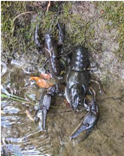
Herr und Frau Edelkrebs im Nebelbach

Die Generation 50Plus der Unterliezheimer kennt ihn noch, den Edelkrebs. Er war im Nebelbach in der Nähe des Löschweihers beheimatet. Auch die Krautgartenbesitzer machten beim Wasserholen öfter Bekanntschaft mit ihm.