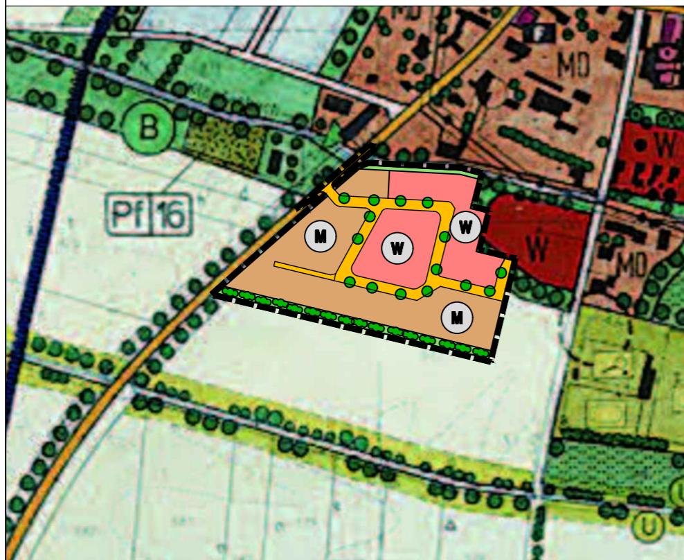
Änderung des Flächennutzungsplans